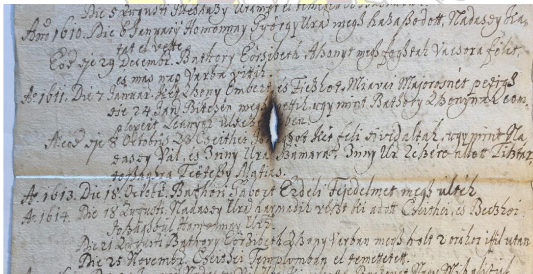
Obr. 1 – Zápisy o zatknutí, uväznení a úmrtí Alžbety Báthoryovej v rokoch 1610 – 1614

Začiatkom roku 1610 dal panovník Matej II. príkaz palatínovi Jurajovi Thurzovi vyriešiť prípad Alžbety Báthoryovej. Ešte pred zverejnením výsledkov vyšetrovania v septembri v testamente rozdelila majetky medzi syna a dve dcéry, aby o nich rodina neprišla. V októbri 1610 pricestovala do kaštiel'a v Čachticiach, kam za ňou prišiel palatín so sprievodom. Podľa spomínaného dokumentu 29. decembra 1610 chytili pani Alžbetu Bathoryovú po večeri a na druhý deň ju odviekli na Čachtický hrad.